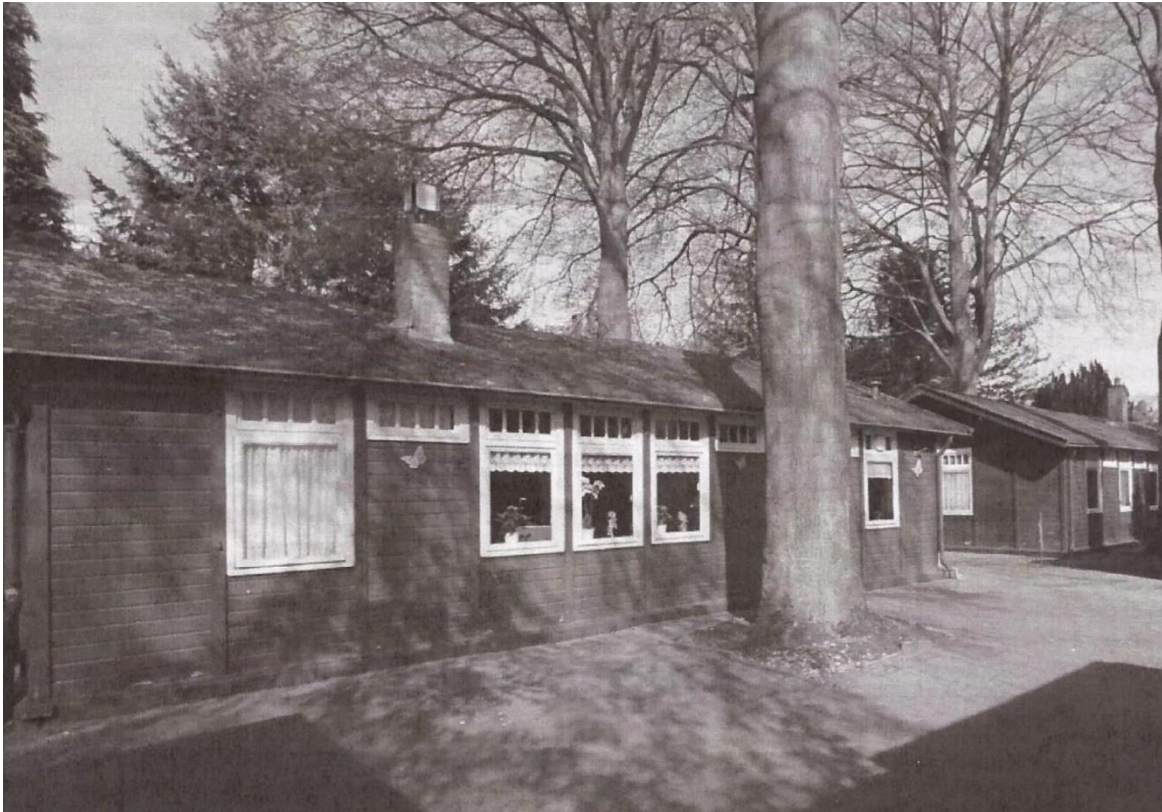
De Ziekenbarakken bij de Generaal Van Heutszlaan in Ede.

Het eerste gebouw zal ook de mogelijkheid bieden tot kleinere vergaderingen en educatieve activiteiten met schoolkinderen. Want als Platform staan we positief tegenover medegebruik van de Smederij en de barakken voor andere organisaties zoals b.v. buurtverenigingen. Bruiloften en partijen staan bepaald niet op onze wensenlijst!