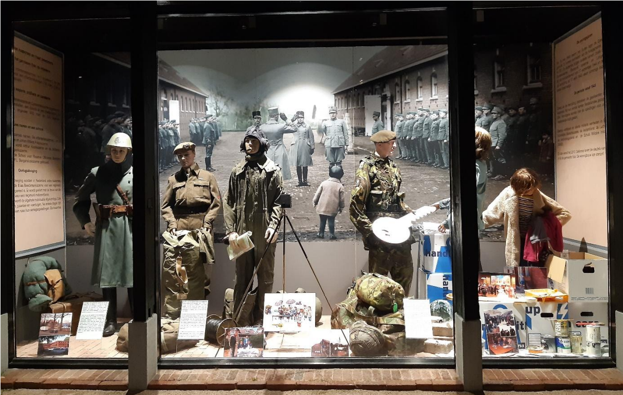
De nieuw ingerichte etalage van De Smederij