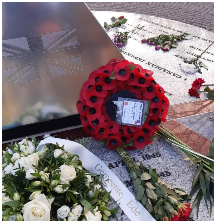
Het Bevrijdingsmonument Ede op 17 april 2021.

Volgend jaar hopen we weer een echte herdenking te kunnen houden, en een grootse en volwaardige viering van onze bevrijding.