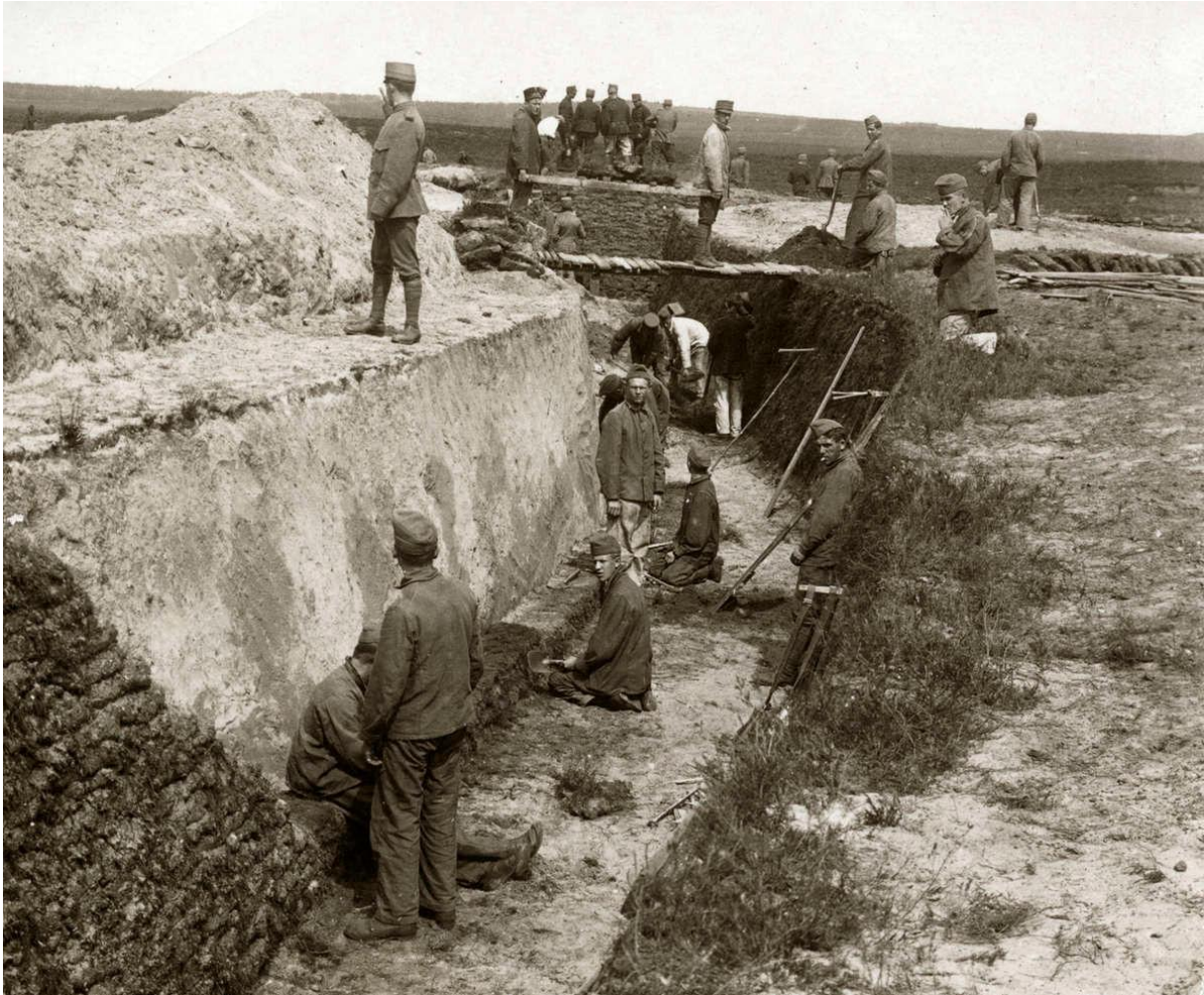
Aanleg Loopgraven tijdens de Eerste Wereldoorlog te Ede.