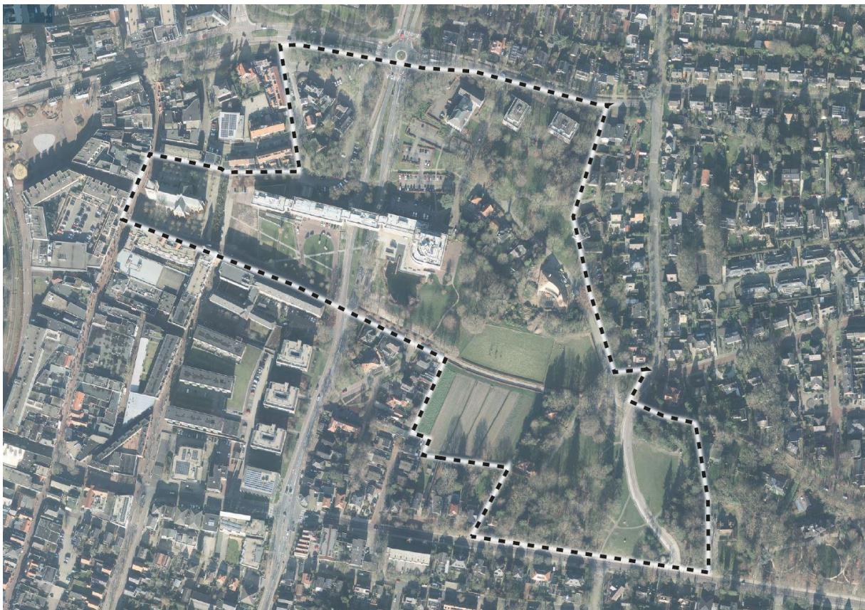
Luchtfoto plangebied Stadspark Ede

Over het Stadspark kunt u meer lezen via de link https://www.ede.nl/in-de-gemeente-edede-in-ontwikkeling/stadspark