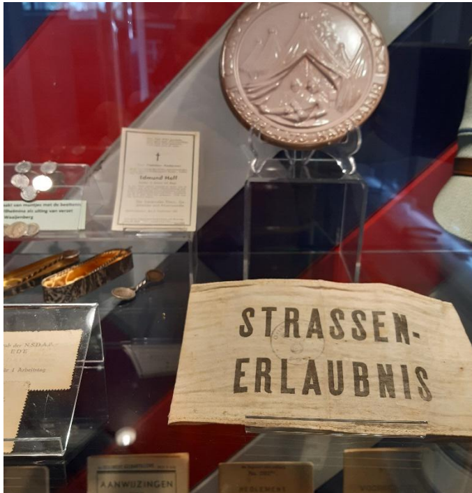
Originele armband "Strassenerlaubnis"